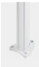
Mast Typ A