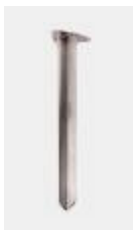
Konsole zum Einschlagen