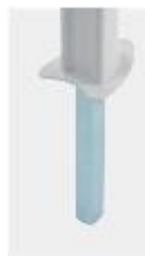
Mast Typ C