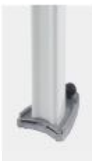
Mast Typ B