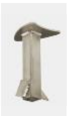
Konsole zum Einbetonieren