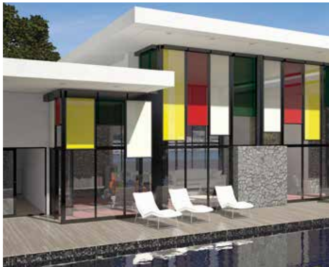
ALUKON-ZipTex der textile Behang.

ALUKON bietet eine große dekorative Vielfalt an Beschattungsmöglichkeiten. Nutzen Sie die zur Verfügung stehenden Farb- und Materialmöglichkeiten für Fassadengestaltung mit Funktion.