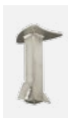
Konsole zum Einbetonieren