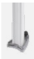
Mast Typ B