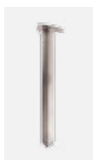
Konsole zum Einschlagen