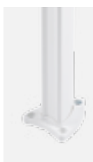
Mast Typ A

Die Windwand erlaubt einen Auszug bis 400 cm Länge, unabhängig vom Dessin.