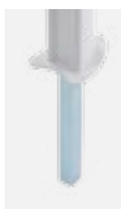
Mast Typ C